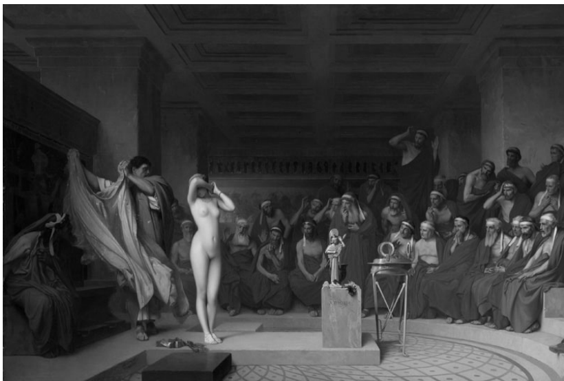
Рисунок 1 – Картина Жана-Леона Жерома «Фріна перед Ареопагом», 1861 р. – Ідеальна метафора "soft power". Тіло жінки стає аргументом сильнішим за закон.

Крім того, у соціальній психології відоме когнітивне упередження: красиве = добре. Ми підсвідомо схильні довіряти привабливим людям, приписувати їм вищий інтелект і кращі моральні якості. Це активно використовується в "soft power". Акаунт бота в соціальній мережі з фотографією привабливої дівчини набере більше підписників і викличе менше підозр при поширенні дезінформації, ніж акаунт з абстрактною картинкою. Краса обеззброює пильність.