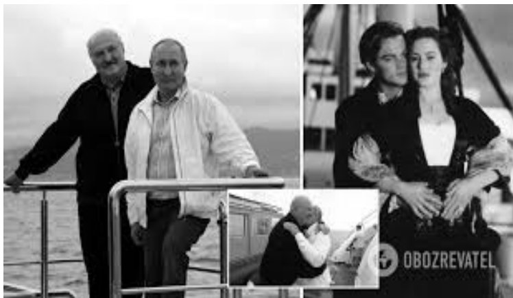
Рисунок 5 – Відомий інтернет-мем «Пугін і Лукашенко» – Приклад "сміхової десакралізації" (Toxic Love), страшні диктатори перетворюються на комічну "стару пару".

XXI століття: цифровий паноптикон. Сьогодні технології зробили кожного з нас потенційною мішенню (а, можливо, навіть і ініціатором впливу) – чи то ми політики, бізнесмени, чи звичайні користувачі соцмереж. Інтернет та соціальні мережі змінили правила гри. Злам хмарних сховищ політиків та публікація інтимних фото стали нормою виборчих перегонів. Штучний інтелект дозволяє створити порно-відео з обличчям вчительки (для булінгу), конкурентки по бізнесу або кандидатки в президенти. Це зброя масового ураження репутації. Це ставить під загрозу сам концепт "істини" в інформаційному просторі. Якщо раніше компромат потрібно було знайти , то тепер його можна створити [304].