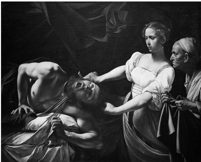
Рисунок 2 – Картина Караваджо «Юдиф та Олоферн». – Класичний архетип "Медової пастки" (Honey Trap).

Імператори та сенатори використовували звинувачення у сексуальних оргіях та інцестах (наприклад, проти Нерона чи Калігули) не стільки заради моралі, скільки для легітимізації політичних убивств та переворотів. Damnatio memoriae (прокляття пам'яті) часто починалося з опису "розпусти".