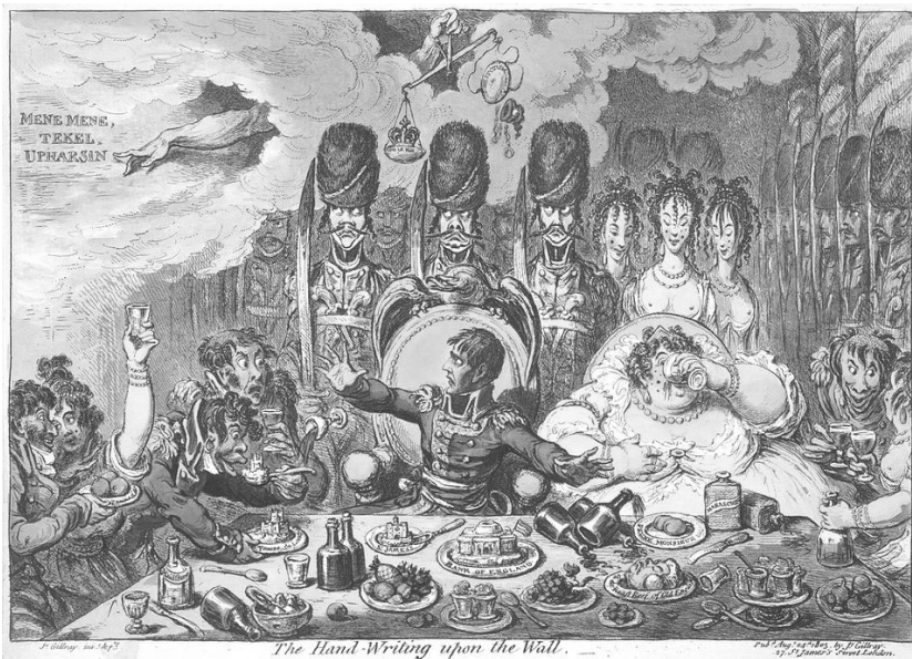
Рисунок 3 – Карикатура Джеймса Гілрея «Почерк на стіні», 1803 р. – Британська пропаганда б'є по іміджу імператора через "аморальність" його дружини.

публічної політики, секс стає інструментом дискредитації, зароджується "чорний піар". Памфлети про "розпусту" Марії-Антуанетти були політичною технологією революціонерів для дискредитації монархії ще до початку збройного повстання і впливали не менш ніж економічні кризи. Сексуальне життя еліт стає предметом публічного обговорення та засудження, що є прямою предтечею сучасних "зливів" компромату, а плітки про будуари аристократів були аналогом сучасних телеграм-каналів з "інсайдами".